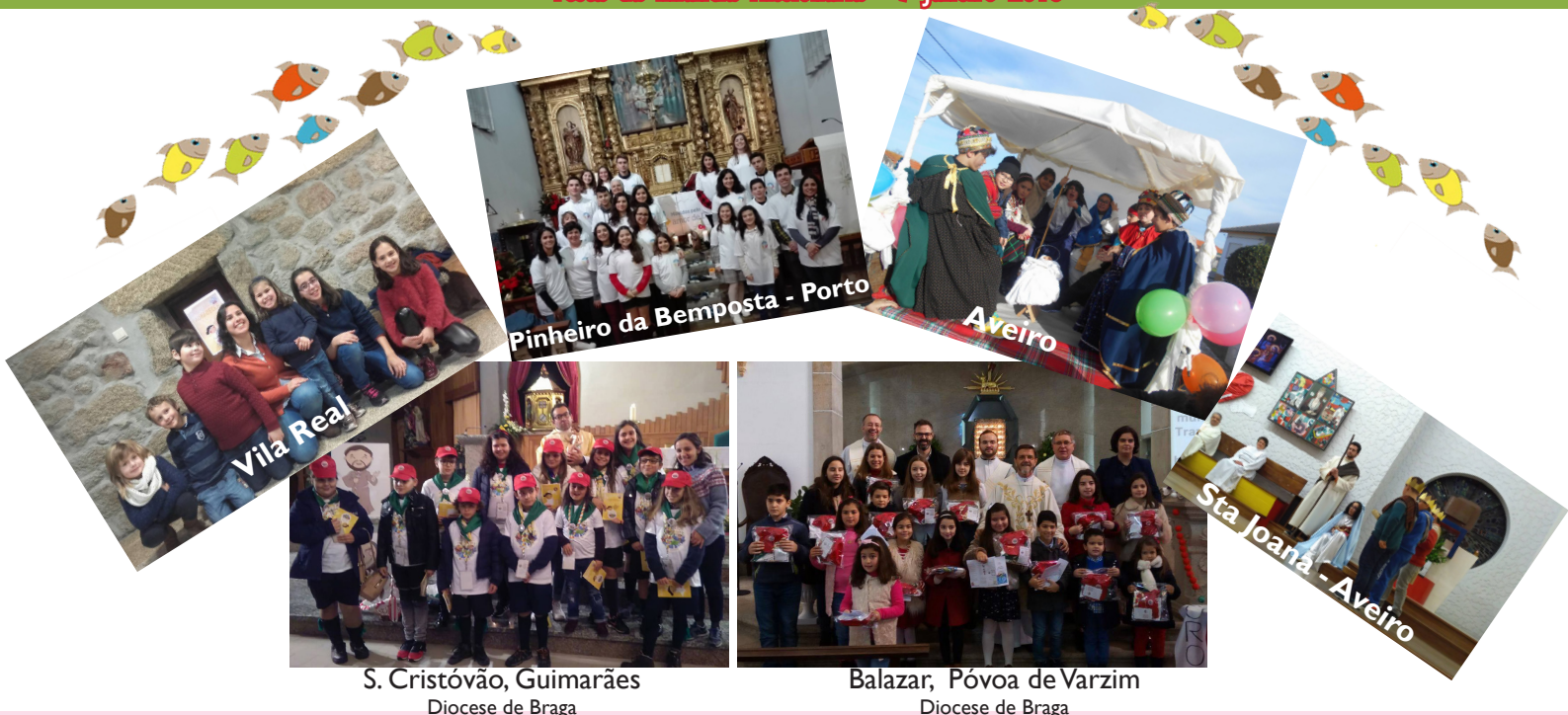
S. Cristóvão, Guimarães Diocese de Braga

Epifania vivida nas Dioceses Festa da Infância Missionária - 7 Janeiro 2018