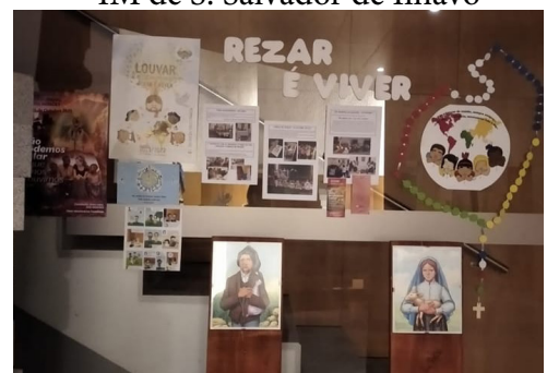
IM da Gafanha da Encarnação.