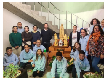
Paróquia de Nossa Senhora de Fátima