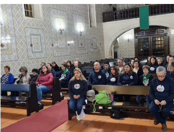
Paróquia de São Miguel de Soza