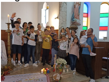
Paróquia de São Pedro de Nariz

No passado domingo, dia 16 Outubro, diversos grupos da IAM, da diocese de Aveiro, rezaram o terço missionário nas suas comunidades paroquiais. O grupo de São Salvador de Ilhavo construiu o seu mural. Aqui ficam alguns recortes: