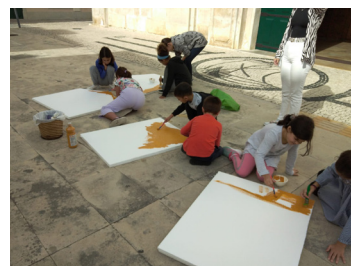
Paróquia de São Salvador de Ilhavo