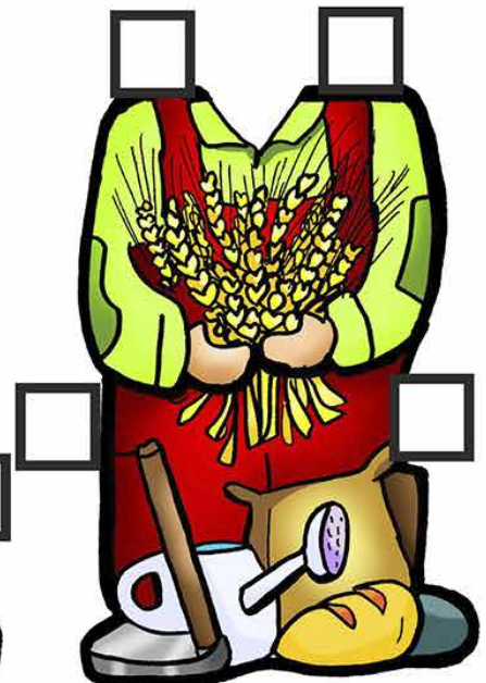
Jo 12,20-33 5º Domingo da Quaresma ... AGRICULTOR