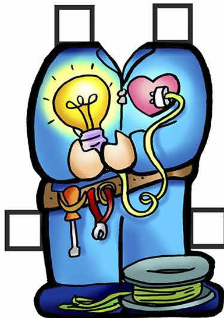
Jo 3,14-21 4º Domingo da Quaresma ... ELECTRICISTA