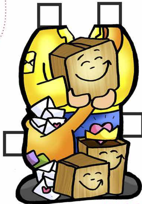
Mc 1,12-15 1º Domingo da Quaresma ... CARTEIRO