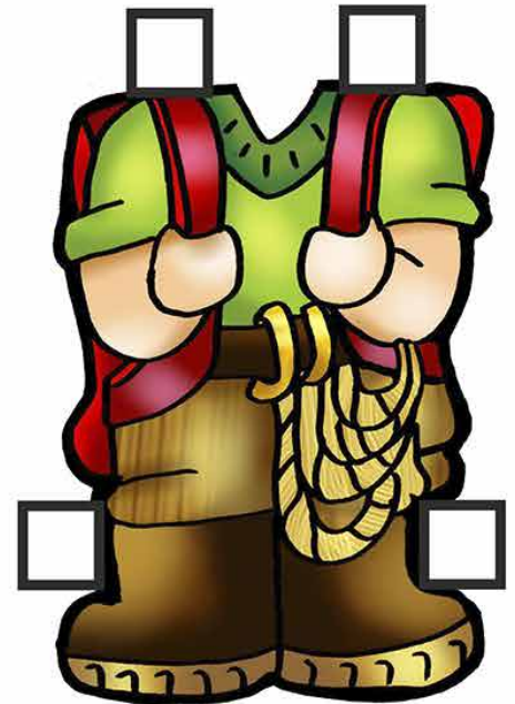
Mc 9,2-10 2º Domingo da Quaresma ... ALPINISTA