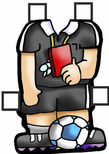
Jo 2,13-25 3º Domingo da Quaresma ... ARBITRO