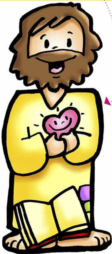
JESUS Mt 6,1-6 O Bom Mestre