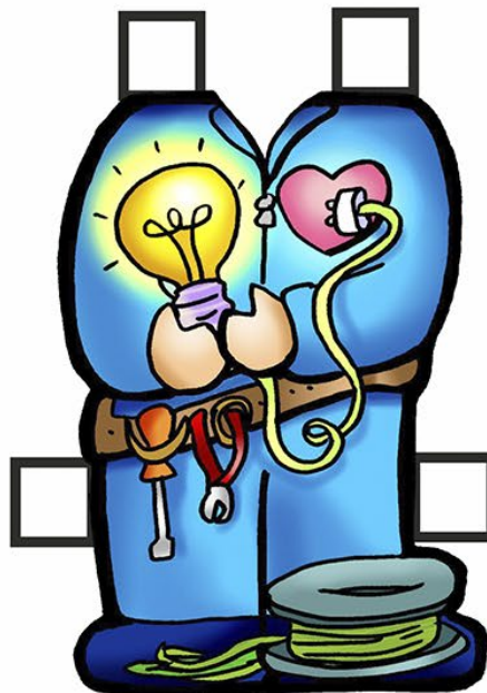
Jo 3,14-21 4º Domingo da Quaresma ... ELECTRICISTA