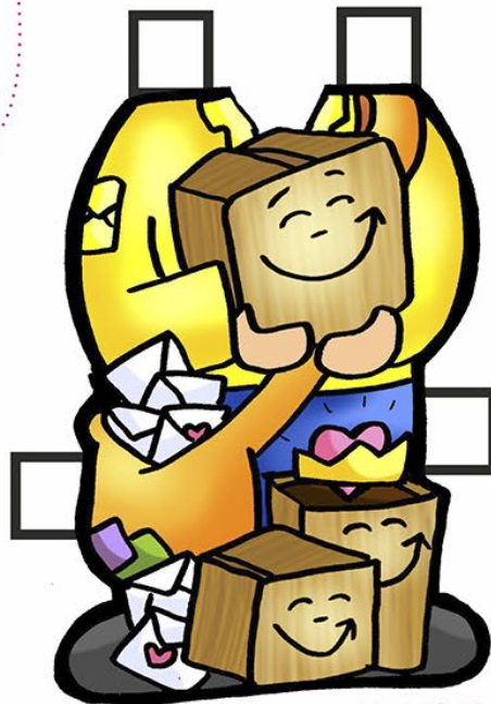
Mc 1,12-15 1º Domingo da Quaresma ... CARTEIRO