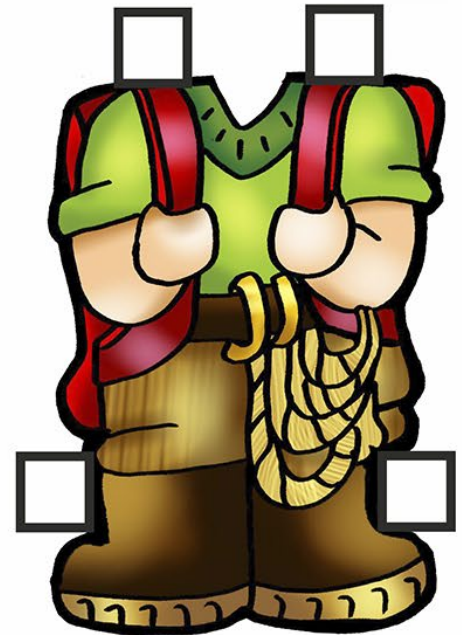
Mc 9,2-10 2º Domingo da Quaresma ... ALPINISTA