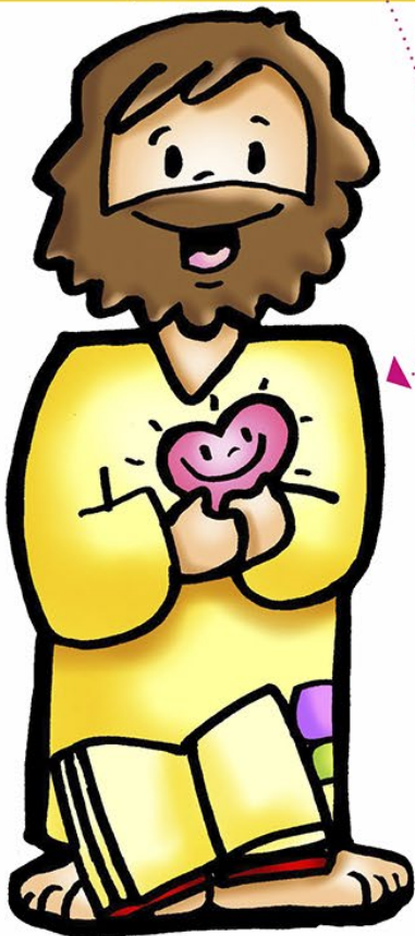
JESUS Mt 6,1-6 O Bom Mestre