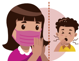
REZAR PELOS DOENTES