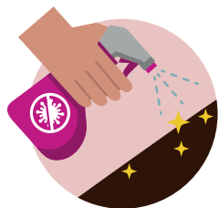
SEMPRE A AJUDAR E DESINFECTAR