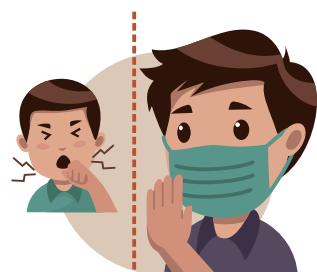
EVITAR O CONTACTO COM OS DOENTES