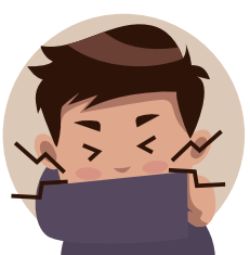
QUANDO TOSSIR TAPAR A BOCA