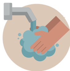
COM FREQUÊNCIA LAVAR AS MÃOS