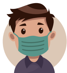
USAR A MÁSCARA